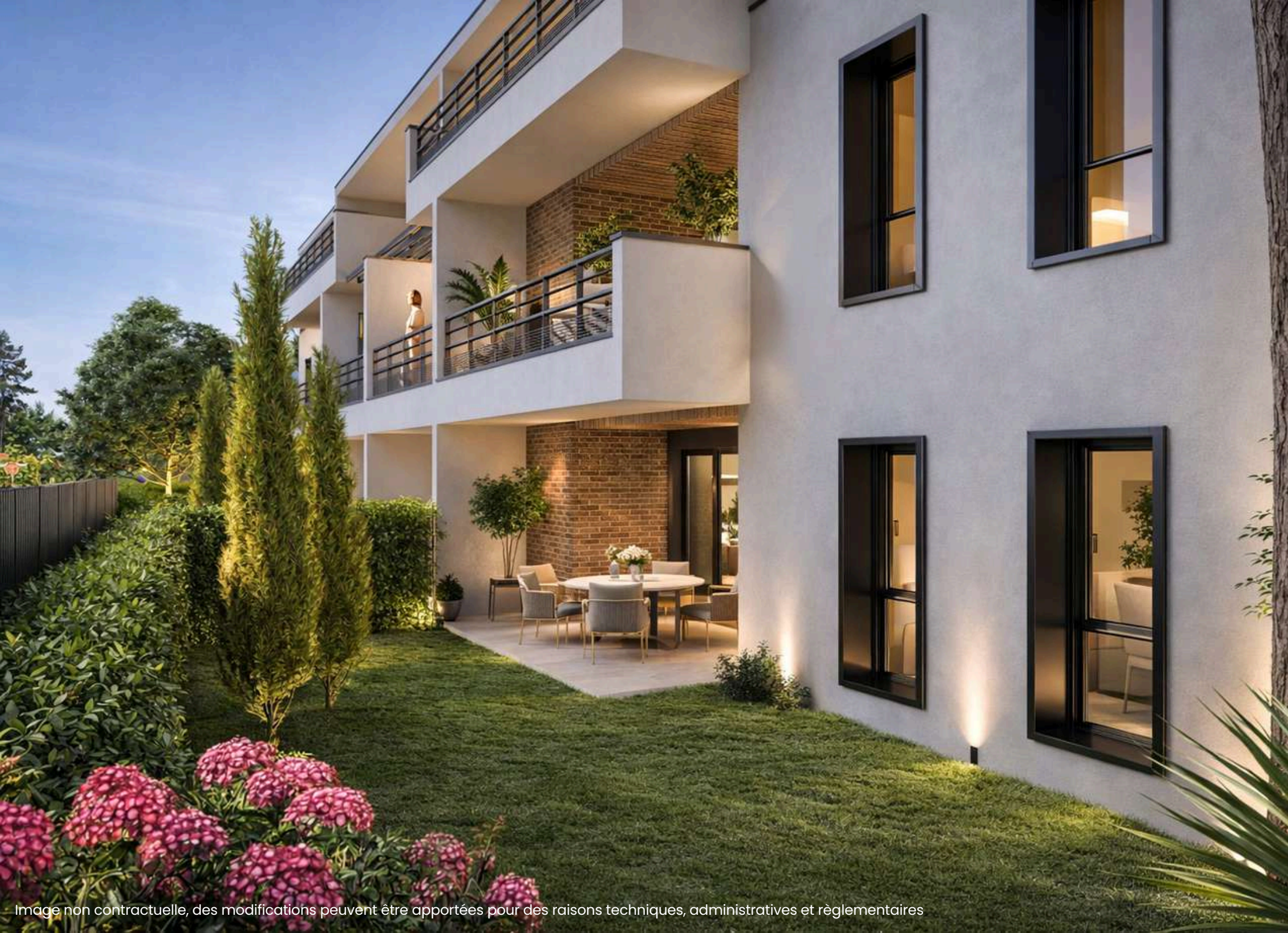
Image non contractuelle, des modifications peuvent être apportées pour des raisons techniques, administratives et réglementaires